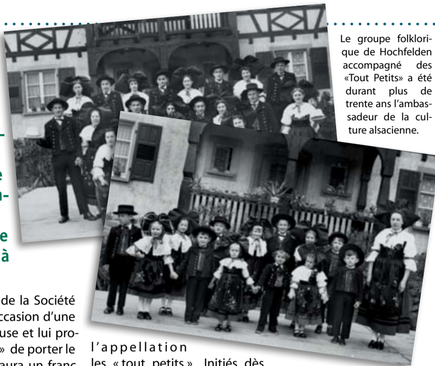
Le groupe folklorique de Hochfelden accompagné des « Tout Petits » a été durant plus de trente ans l'ambassadeur de la culture alsacienne.

Toujours en 1955, une dizaine de « couples » d'enfants, âgés de 4 à 13 ans, sont intégrés au groupe folklorique sous