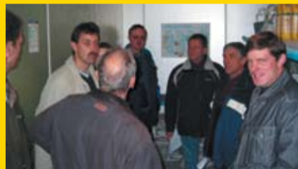
Une visite d'exploitation à Niedernai.